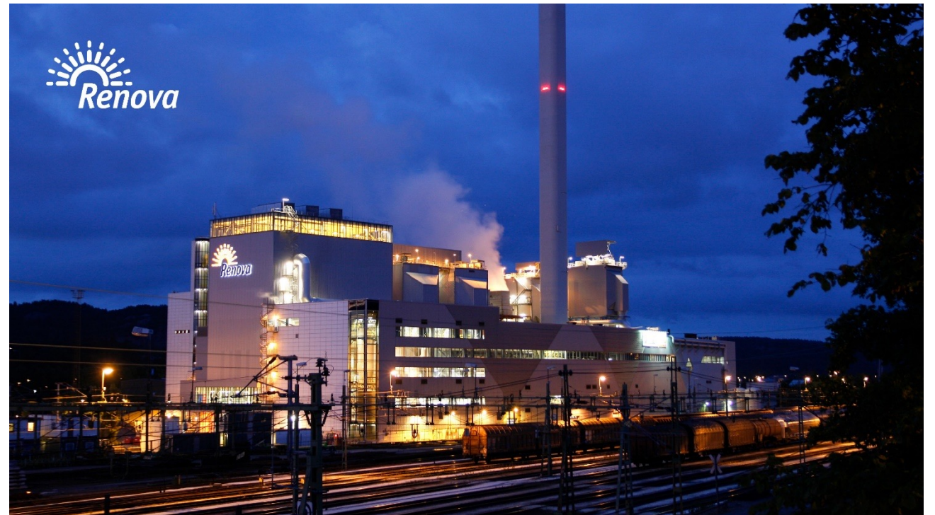
Renovas avfallskraftvärmeverk i Sävenäs

Men också 0,5% av Sveriges totala växthusutsläpp